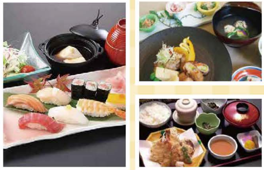
※入居者さま向け給食とは内容が異なります

イベント限定のスペシャルランチを是非ご堪能ください! ※毎日メニューが変わりますので予めご了承ください