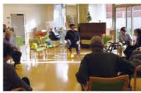
理学療法士による体操教室