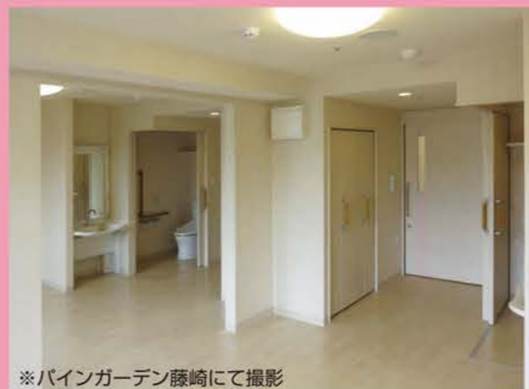
※パインガーデン藤崎にて撮影

パインガーデン室見・パインガーデン藤崎 どちらにも限定数、 ご用意することが可能になりました。