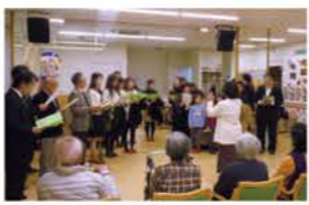
クリスマスの歌会