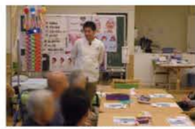
歯についての講習会