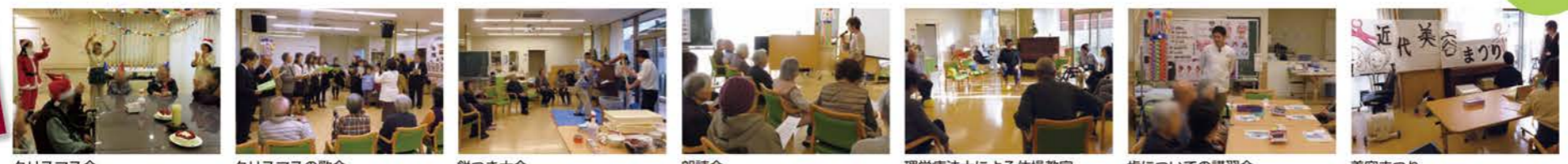
クリスマス会 クリスマスの歌会 餅つき大会 朗読会 理学療法士による体操教室 歯についての講習会 美容まつり

無料 デイサービスセンター グリーングラス 見学・体験 随時受付中 見学時間 9:00~16:00 毎週月~金曜日で、ご希望日の前日までに お電話でご予約ください。 092-847-1518